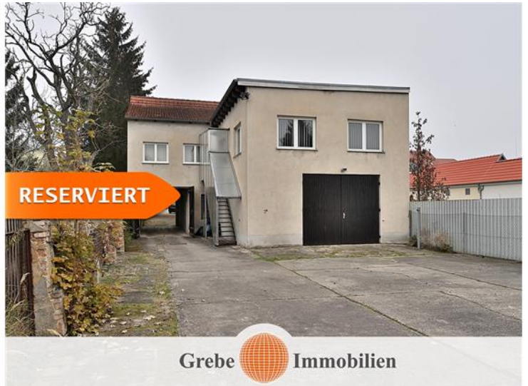
Kleine Lagerhalle ...