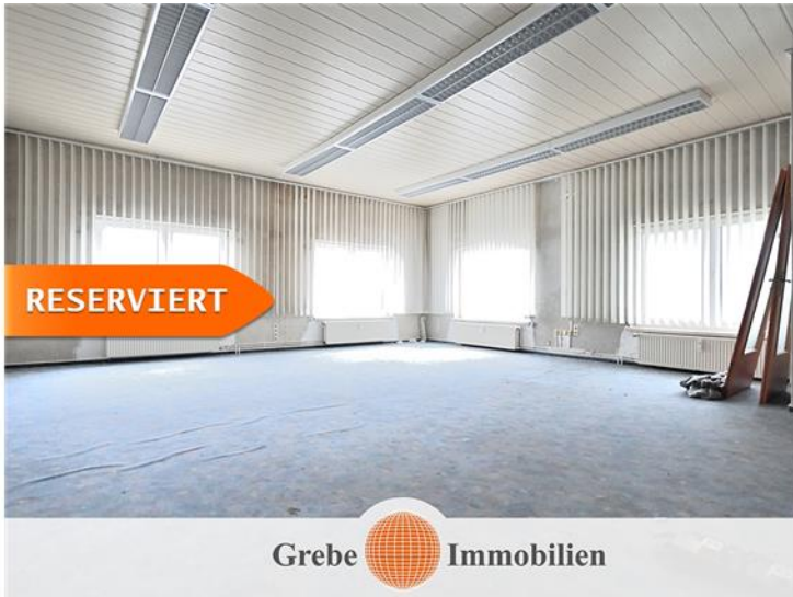
Größter Raum OG