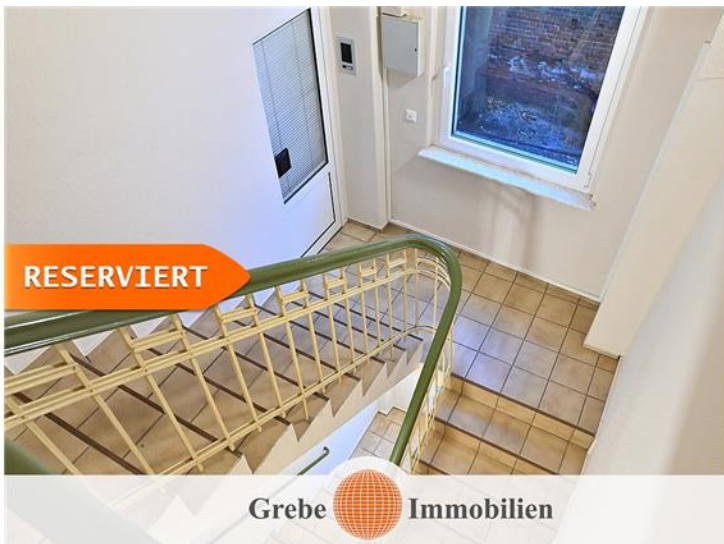
Zu Whg und Gewerbe OG