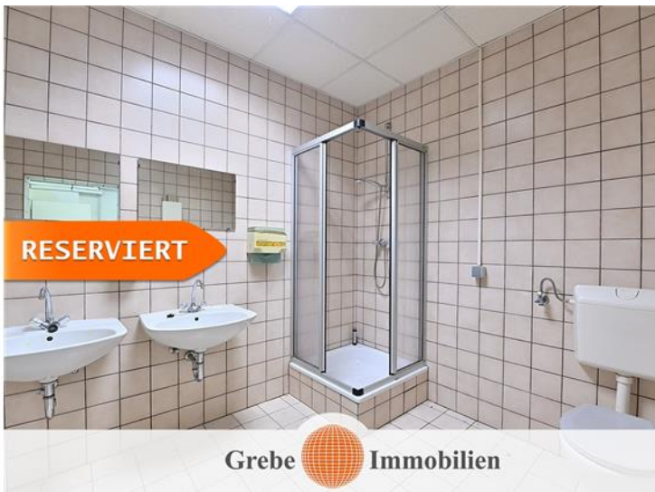
WC Anlagen EG