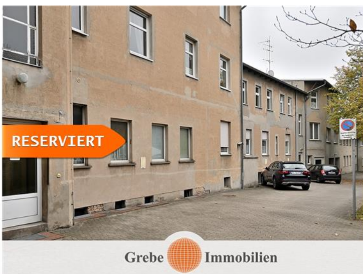
Zugang EG und OG