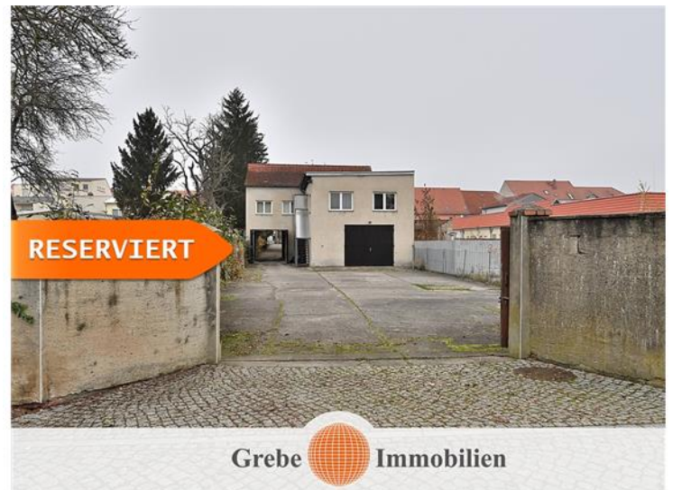
Zufahrt von hinten