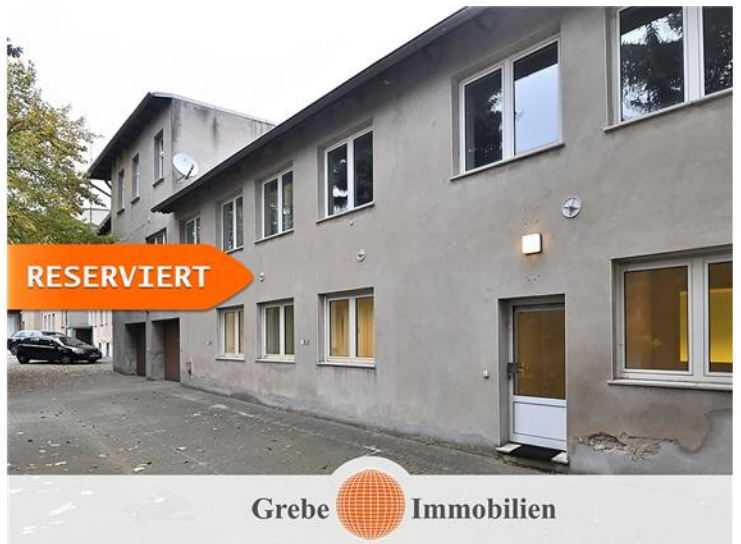
Zugang freies Gewerbe