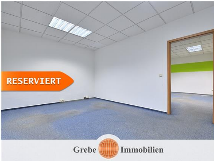
Bürozimmer 2 EG