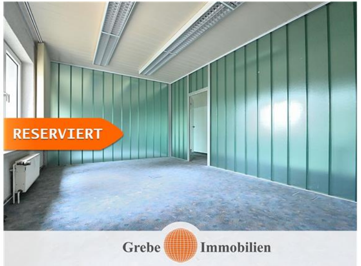
3 Räume in der Art