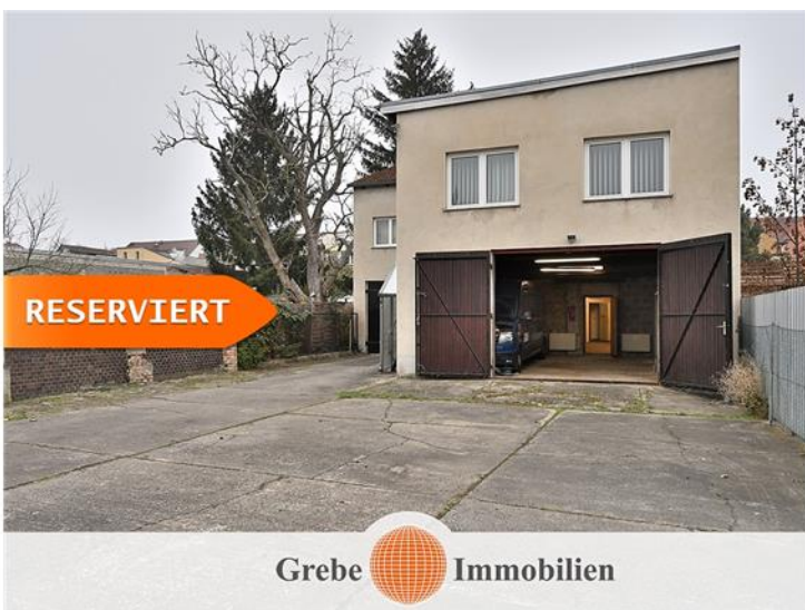
... oder ...