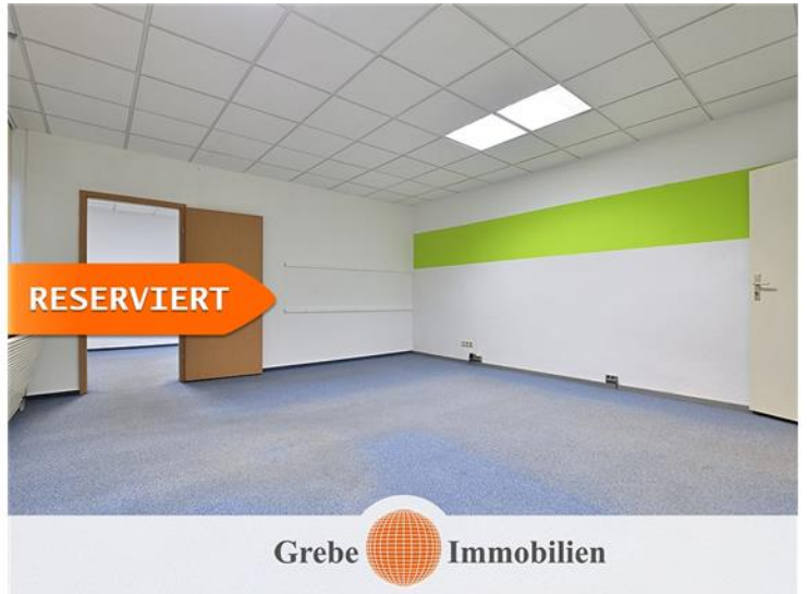
Bürozimmer 3 EG