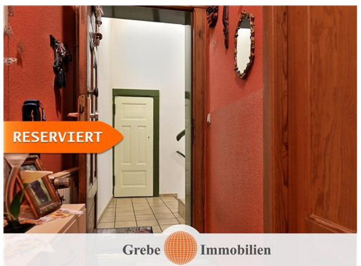
EG links HH