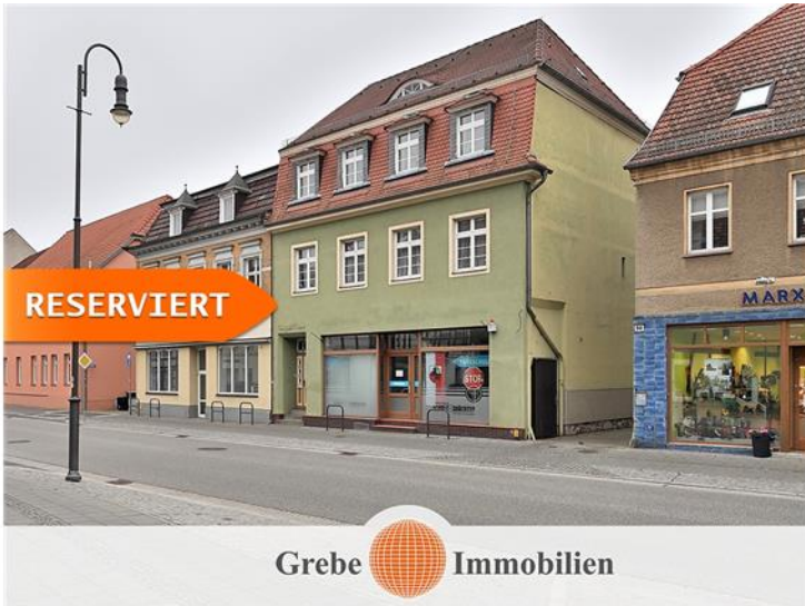
Pferdestraße 52 Juterbog