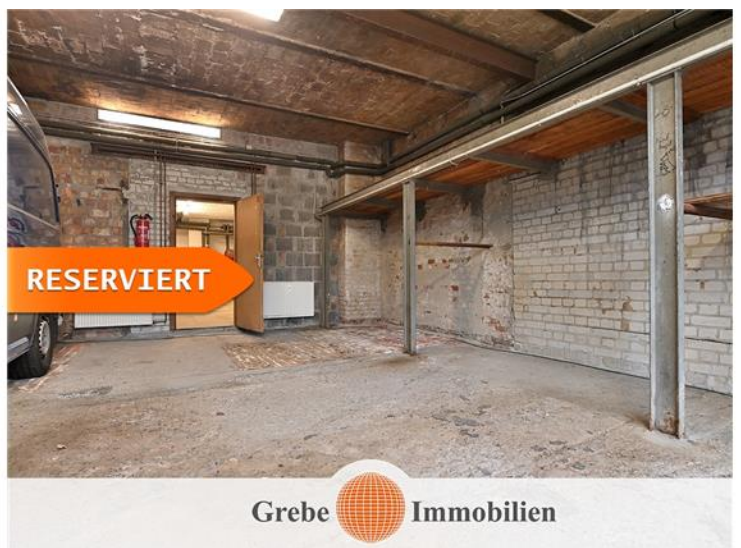
... große Garage