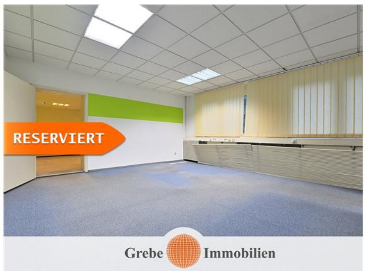
Bürozimmer 1 EG